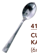
410 400 01 CUILLÈRES À CAFÉ KAFFEELÖFFEL (6x)