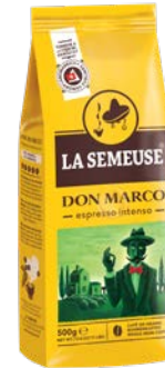
100 410 50 DON MARCO Grains | Bohnen (500g)