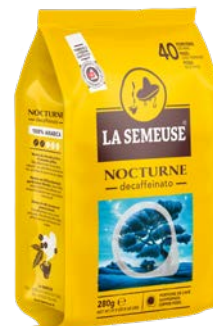
100 330 40 NOCTURNE Portions | Pads (40x)