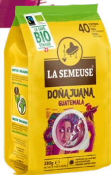
101 310 40 DOÑA JUANA Portions|Pads (40x)