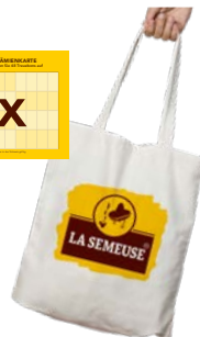
451 600 01 SAC EN COTON | BAUMWOLLTASCHE Blanc | Weiss