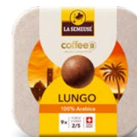
100 191 09 LUNGO Boules de café Coffee balls (9x)