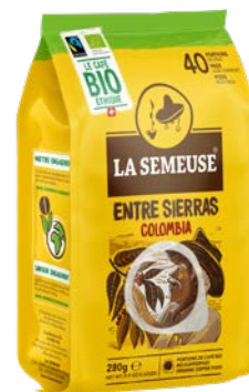
101 210 40 ENTRE SIERRAS Portions|Pads (40x)