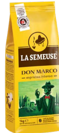
100 411 00 DON MARCO Grains | Bohnen (1kg)