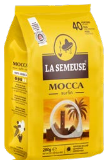
100 130 40 MOCCA SURFIN Portions | Pads (40x)