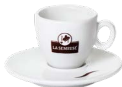
400 850 01 BARISTA Ristretto / Espresso (7 cl)