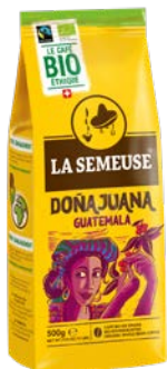
101 310 50 DOÑA JUANA Grains | Bohnen (500g)