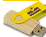
434 100 01 CLÉ USB | USB-STICK Bois | Holz 16GB