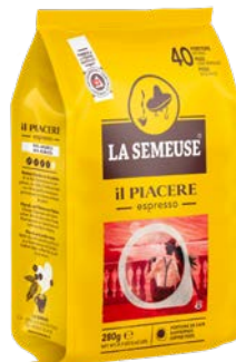
100 830 40 IL PIACERE Portions | Pads (40x)