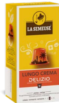
101 050 16 LUNGO CREMA Capsules | Kapseln (16x)

*Delizio® est une marque déposée de la Fédération des coopératives Migros, Zurich. / Delizio® ist eine eingetragene Marke des Migros-Genossenschafts-Bundes, Zürich.