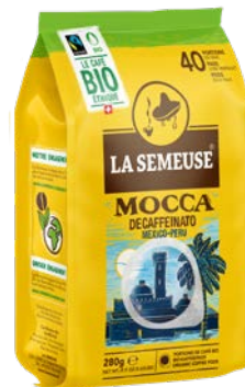
100 184 40 MOCCA BIO DECAFFEINATO Portions | Pads (40x)