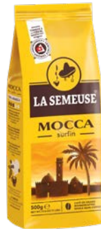
100 110 50 MOCCA SURFIN Grains | Bohnen (500g)