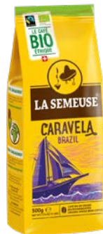
101 312 50 CARAVELA Grains | Bohnen (500g)