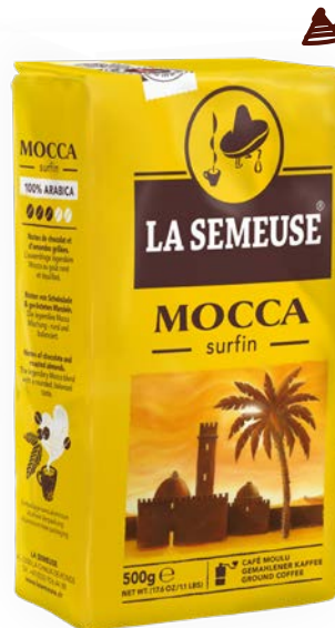
Illustration de l'article Artikelbild