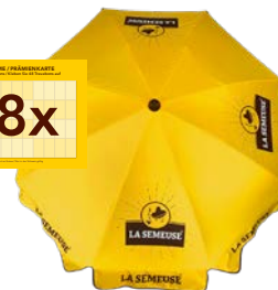
430 900 01 PARASOL SONNENSCHIRM