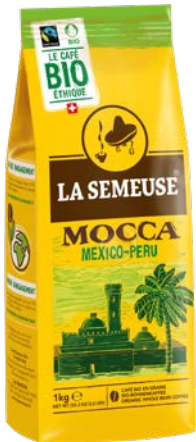
100 181 00 MOCCA BIO Grains | Bohnen (1kg)