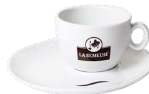
400 860 01 BARISTA Café (17 cl)