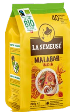
101 211 40 MALABAR INDIA Portions|Pads (40x)