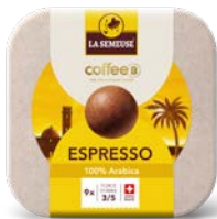
100 190 09 ESPRESSO Boules de café Coffee balls (9x)