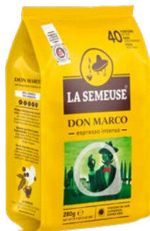
100 430 40 DON MARCO Portions | Pads (40x)