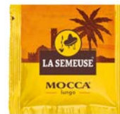
100 131 55 MOCCA LUNGO Portions|Pads (150x)