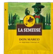
100 431 50 DON MARCO Portions|Pads (150x)