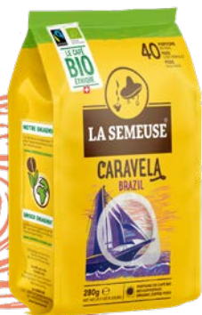
101 312 40 CARAVELA Portions | Pads (40x)