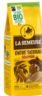
101 210 50 ENTRE SIERRAS Grains | Bohnen (500g)