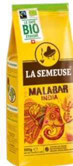
101 211 50 MALABAR INDIA Grains | Bohnen (500g)