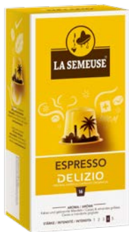
102 050 16 ESPRESSO Capsules | Kapseln (16x)