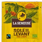
100 731 50 SOLEIL LEVANT Portions|Pads (150x)