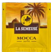
100 131 50 MOCCA SURFIN Portions|Pads (150x)