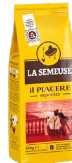
100 810 50 IL PIACERE Grains | Bohnen (500g)