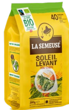
100 730 40 SOLEIL LEVANT Portions | Pads (40x)