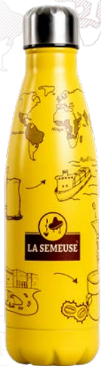
432 300 08 GOURDE ISOTHERME THERMO TRINKFLASCHE Décor Voyage | Reisedekor (500ml)