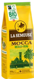
100 180 50 MOCCA BIO Grains | Bohnen (500g)