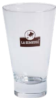
401 570 01 SHETLAND Latte Macchiato (35 cl)