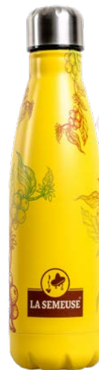
432 300 09 GOURDE ISOTHERME THERMO TRINKFLASCHE Décor Cafier | Kaffeebaum-dekor (500ml)