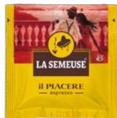
100 831 50 IL PIACERE Portions|Pads (150x)