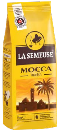
100 111 00 MOCCA SURFIN Grains | Bohnen (1kg)