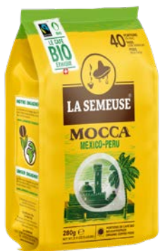
100 183 40 MOCCA BIO Portions|Pads (40x)