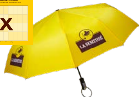
430 800 01 PARAPLUIE REGENSCHIRM