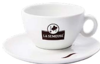
400 870 01 BARISTA Cappuccino (26.5 cl)