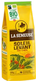
100 710 50 SOLEIL LEVANT Grains | Bohnen (500g)