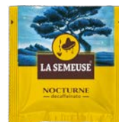
100 331 50 NOCTURNE Portions|Pads (150x)