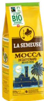
100 184 50 MOCCA BIO DECAFFEINATO Grains | Bohnen (500g)