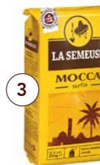
Illustration de l'article Artikelbild